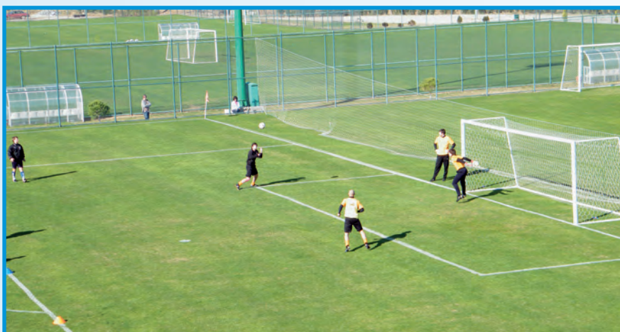
Die Anlage in Side bestehend aus fantastisch gepflegten Rasenplätzen mit modernster Infrastruktur