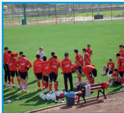
Die Schweizer U17-Nati beim Training - später dann Weltmeister!